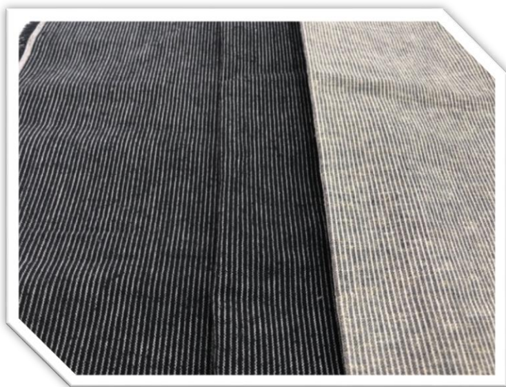
11FF-2-1 先染綿バンブー 綿75% 竹25% 巾138cm

開織・繊維の持つドライな風合いです。サステイナブル素材としてアパレル・小物・雑貨まで多用途に使用してください。