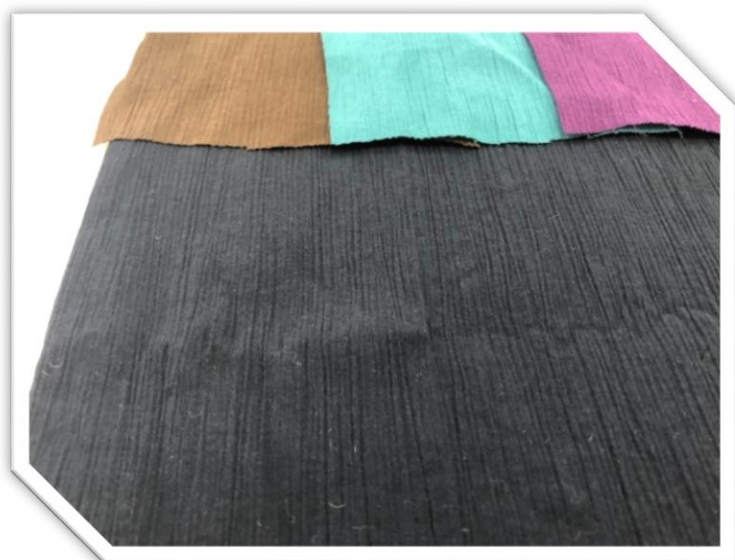
11FF-1 80ちぢみ 綿100% 巾105cm